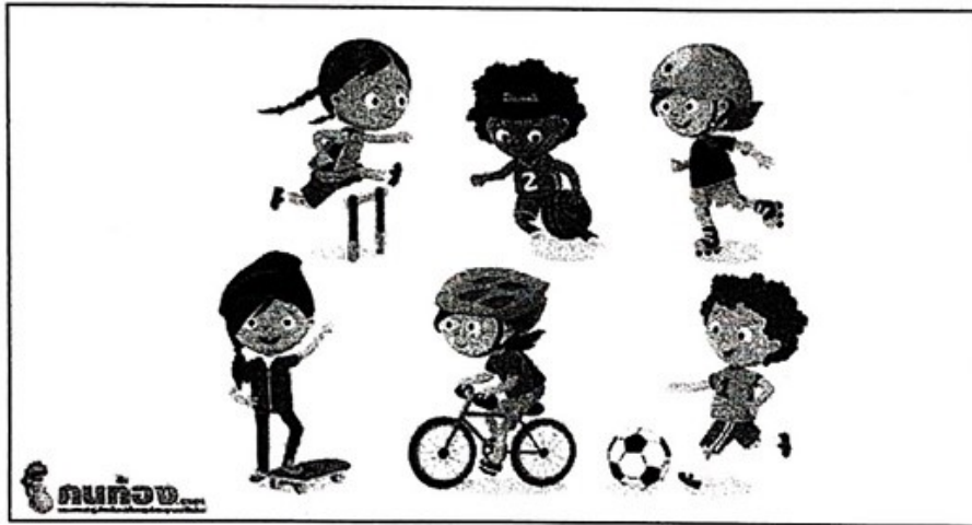
ภาพที่ 1 แสดงเทคนิคการส่งเสริมพัฒนาการเด็ก